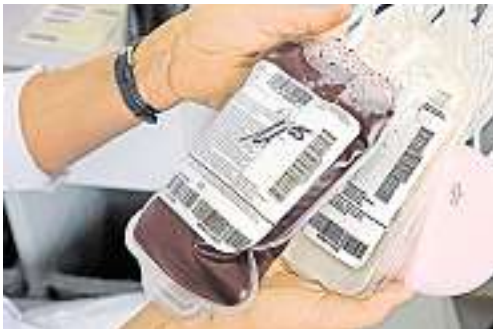
Jede Blutspende wird im Labor genau untersucht.

In der Schweiz wurde dieses Jahr schon fast 160 000-mal Blut gespendet. In den Sommerferien oder während Grossanlässen wie der Euro aber sind viele Spender abwesend oder finden keine Zeit zu spenden. Da Blut nicht lange haltbar ist, kann Spender-