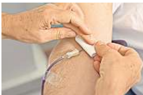
... so schnell, dass nach wenigen Minuten alles wieder vorbei ist ...