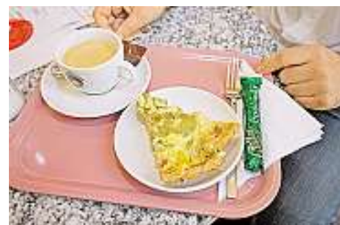
.. zum Abschluss und zur Stärkung gibt es Kaffee und ein Stück Wähe.