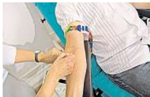
...ist alles in Ordnung, wird der Spender angestochen...