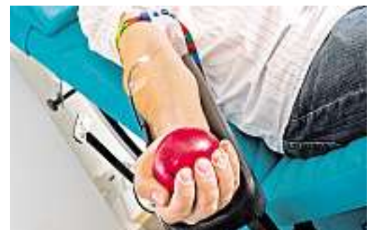
...leichtes Pumpen lässt das Blut schneller laufen...