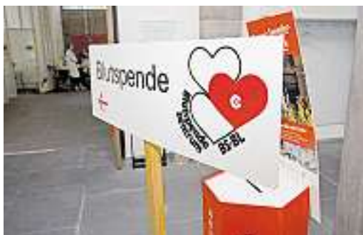
Ein grosses Schild weist den Weg zum Blutabzapfen...