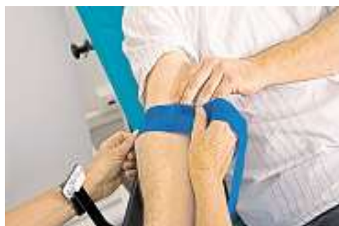
... die Einstichstelle wird säuberlich verbunden ...