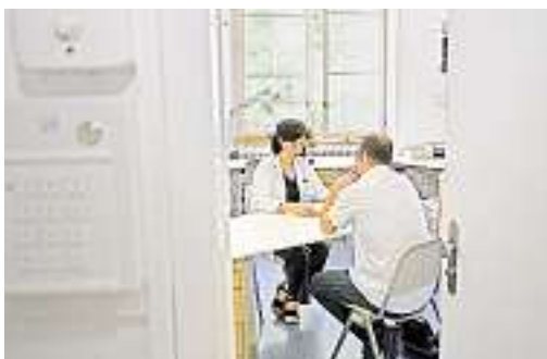
... eine Ärztin erklärt mir den Ablauf der Spende und was mit dem Blut passiert...