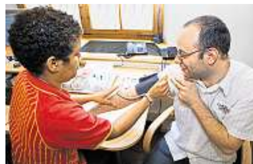
... danach gehts los: zuerst wird der Blutdruck gemessen...